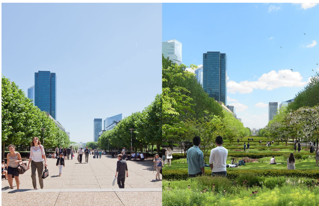
Avant/après : l'esplanade de La Défense évolue - Paris La Défense

En ce qui concerne la température, ça ne devrait pas aller en s'améliorant. Le quartier de La Défense fait partie de ces îlots de chaleur qui pourraient faire fuir d'éventuels résidents, travailleurs ou passants. C'est l'une des raisons qui ont poussé Georges Siffredi à demander la création du « Parc ». Cinq hectares de verdure, qui, à l'horizon 2030, devraient faire de La Défense le premier quartier d'affaires « postcarbone » au monde. Grâce à cette étendue de 600 mètres, vue sur l'Arc de Triomphe, le quartier devrait réduire de 50 % son empreinte carbone.