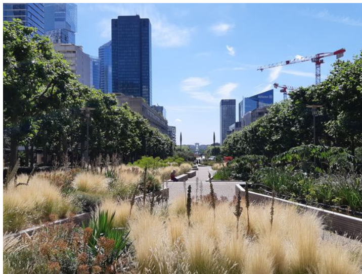
Aujourd'hui, 35% de la surface de l'esplanade est végétalisée.

Les dalles de béton seront donc progressivement remplacées par un sol stabilisé (un mélange de gravier de sable et d'eau), identique à celui qu'on trouve à Versailles ou aux Tuileries. Aux 450 arbres existants seront ajoutées des strates de végétation supplémentaires. "Dans les jardins à la française classiques, souvent, vous avez sous les arbres d'autres éléments arbustifs qui forment une autre couche de végétation" , explique Michel Desvigne.