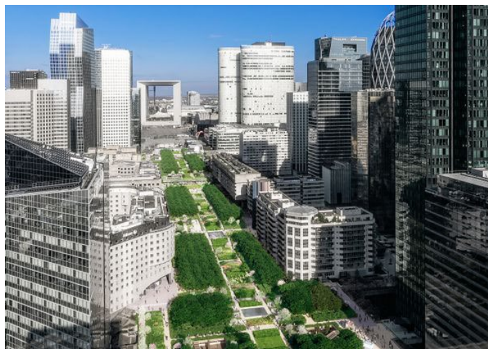
Vue aérienne du projet de Michel Desvigne - MDP - Paris La Défense